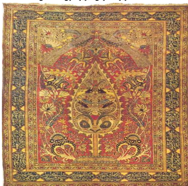
منبع: رویای بهشت، جلد ۲: ۲۳

تفسیر نامی پتگر نیز از آن حیث که وجوه مشابهتی با مضامین مذهبی کتاب معاد اثر آیت‌اله دستغیب دارد حایز اهمیت است. از جمله مضامین مورد اشاره در کتاب فوق طریقه سربرآوردن کفار و مومنین از قبر در روز حشر است که قابلیت همسان‌سازی با الگوهای نقش‌پردازی واق را دارد (دستغیب، ۱۳۶۰: ۹۳). پتگر در مورد فرش تصویر شده در همین مقاله یعنی درخت واق ابریشم بافت هریس از مجموعه خصوصی حکیمیان، همچون درخت جان یاد می‌کند که نقش آن نمادی از پنجره‌ای گشوده به درون وجود انسانی است و هر حیوانی در آن نمادی از انرژی‌های درونی جان انسان به حساب می‌آید (حصوری، ۱۳۸۲: ۱۰۱-۱۰۰). در تالیفات غربی از منظر اسطوره‌ای درخت سخنگو بدان پرداخته می‌شود.