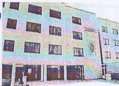
مجتمع خوابگاهی مرحوم ناظران